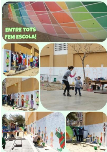
Curs 2015-16: Escola El Garrofer (Viladecans) i Can Palmer (Viladecans)