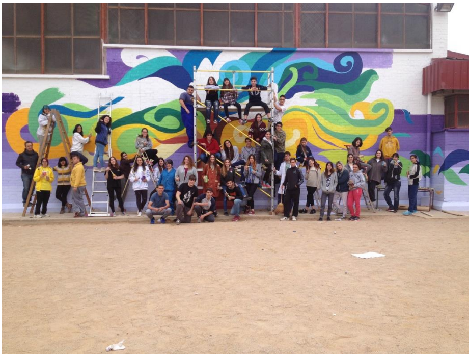
Curs 2016-17: Mural del pati del nostre Institut